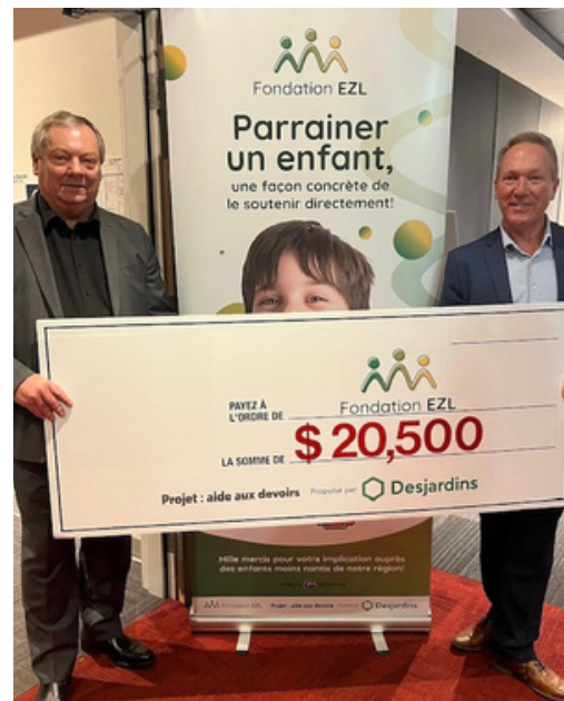
Spectacle bénéfique au Zénith de St-Eustache