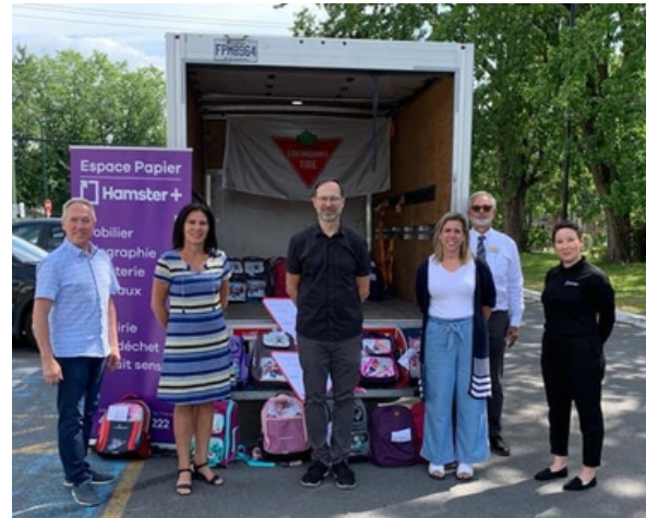
Remise des sacs à dos pour les enfants des écoles Des Perséides et Curé Paquin

Nous constatons une augmentation du nombre d'enfants démunis nécessitant notre aide dans l'un et/ou l'autre de nos projets. Nous devons trouver des sources de financement qui nous permettront de répondre à la demande croissante.