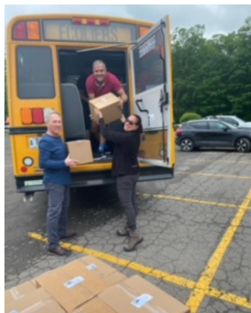
BBQ Bières et Saucisses