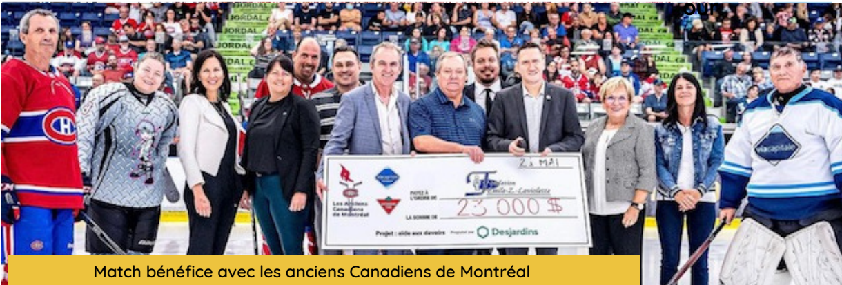
Match bénéfique avec les anciens Canadiens de Montréal