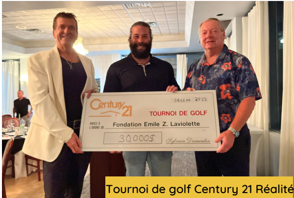
Tournoi de golf Century 21 Réalité